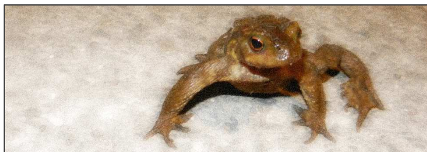
Rosel, le 5 mars 2013